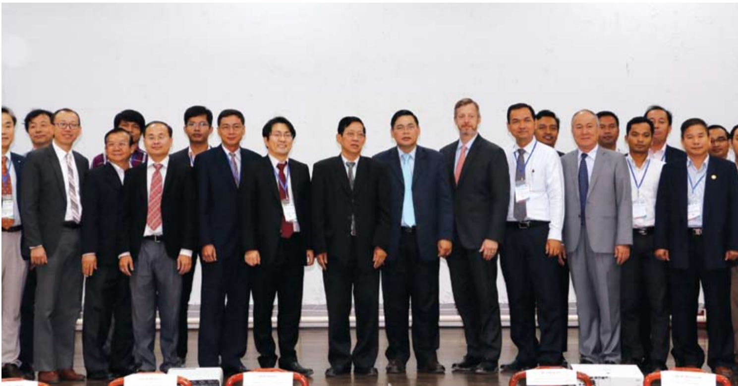
ថ្នាក់ដឹកនាំសាកលវិទ្យាល័យ និងគណៈប្រតិភូរដ្ឋបាលផ្សព្វផ្សាយ និងលើកកម្ពស់ការសិក្សាតាមបែប E-Learning