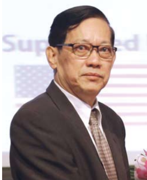
ឯកឧត្តម យក់ អ៊ុយ