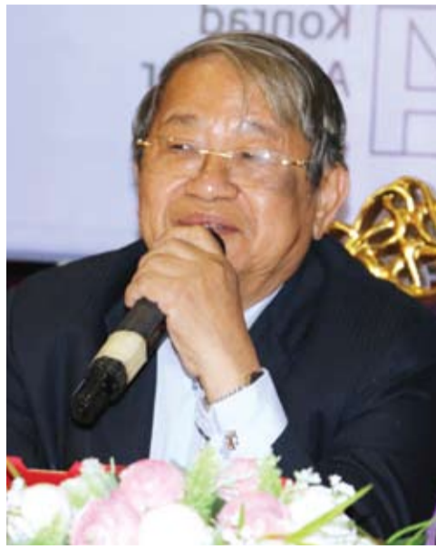
ឯកឧត្តម ខៀវ កាញារីទ្ធ