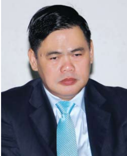
ឯកឧត្តម អ៊ិម អៀង