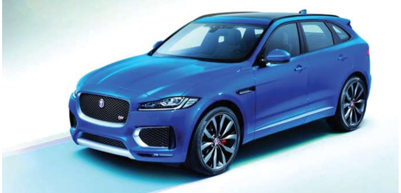
អាននៅទំព័រ (26)