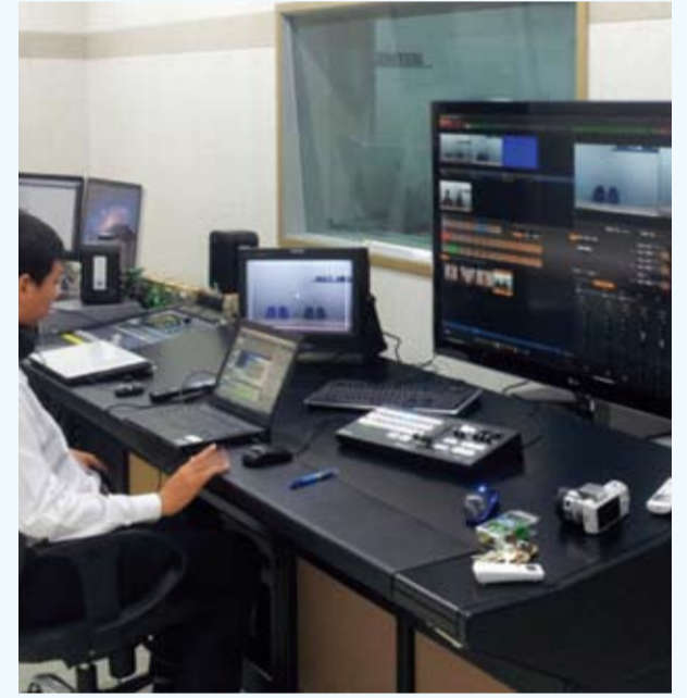
អាននៅទំព័រ (24)